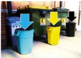
Op de speelplaats